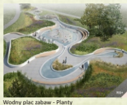
Wodny plac zabaw - Plany