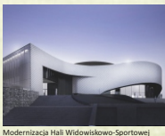
Modernizacja Hali Widowiskowo-Sportowej